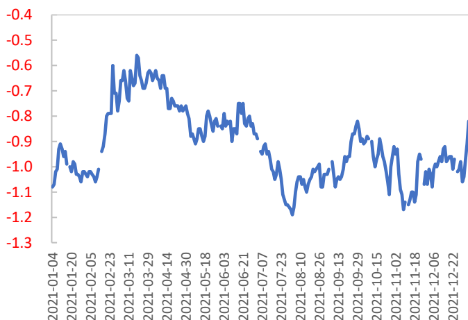
图表 5: 10 年美债实际收益率 (%)