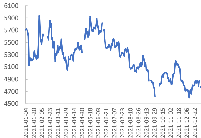
图表 2: Ag 活跃合约价格 (元)