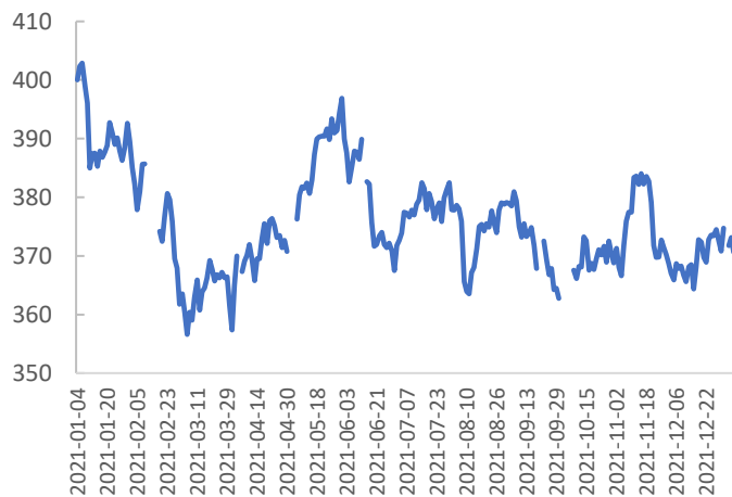
图表 1: Au 活跃合约价格 (元)