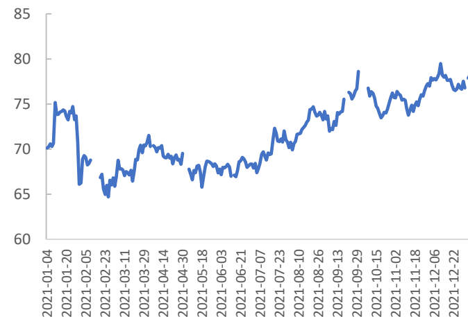
图表 3: 国内金银比价