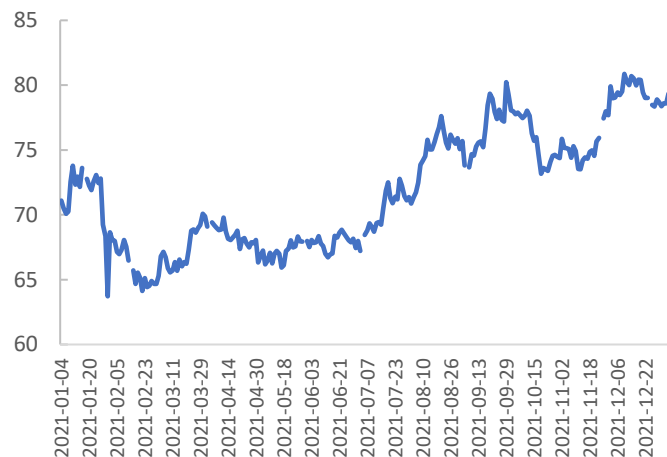
图表 4: COMEX 金银比价