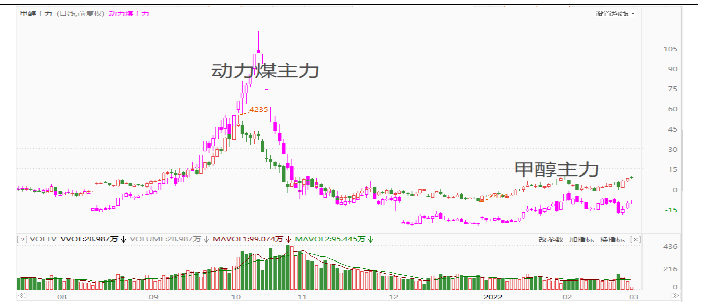
图表 2：郑醇主力与郑煤主力叠加走势图

从产业链来看，煤价对甲醇价格的传导有一定的逻辑机制：甲醇相对于聚烯烃等其他化工品而言，其装置负荷可调整范围及灵活性较大，由于当前在需求不足的压制下，甲醇产能相对过剩，煤化工装置亏损面较大，因此国内甲醇装置整体开工负荷降低，而降低的这部分装置负荷属于对利润敏感的弹性开工负荷。