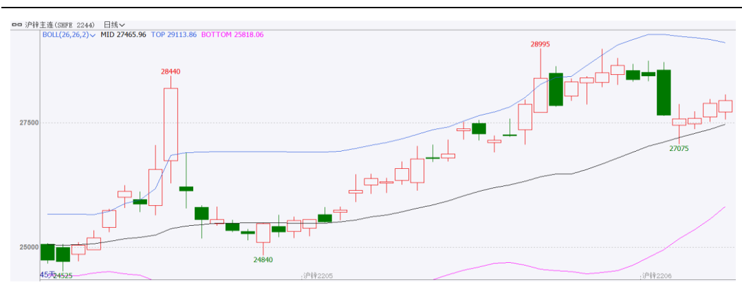
图表1：沪锌主力合约走势图

4月，沪锌主力合约冲高回落。开盘价26790元/吨，收于27950元/吨，月涨1165元/吨，或4.20%。波动范围：26730~28995。成交量减少32.7万手至348.5万手。持仓量增加11360手至12.2万手。