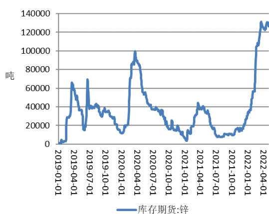
图表：上期所锌库存走势