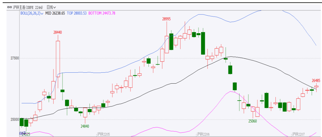
图表 1：沪锌主力合约走势图

范围：25060~27940。成交量减少 293079 手至 3191600 手。持仓量减少 12592 手至-12592 手。