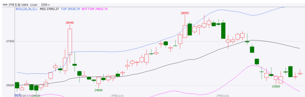
图表 1：沪锌主力合约走势图