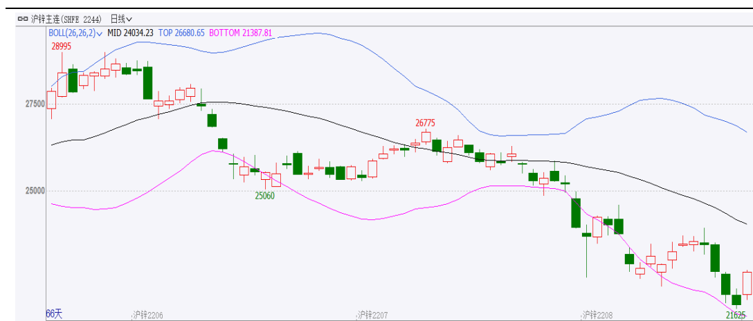
图表 1：沪锌主力合约走势图

本周，沪锌主连开盘价 23450 元/吨，收盘价 21720 元/吨，周跌 1750 元，或-7.46%。波动范围 21625~23925 元/吨。成交量增加 18.5 万手至 1370317 手。持仓量减少 5486 手至 105039 手。