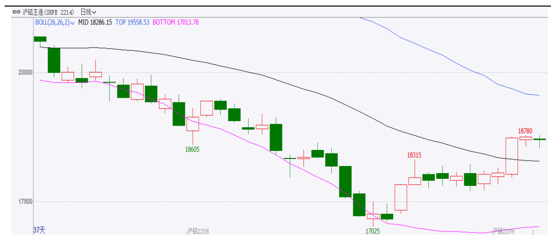
图表 1：沪铝主力合约走势图

月跌 310 元/吨，或 1.64%，波动范围：17025~19390。成交量增加 350140 手至 5882055 手，持仓量减少 1328 手至 180533 手。