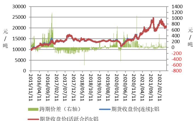
图表：铝跨期价差走势