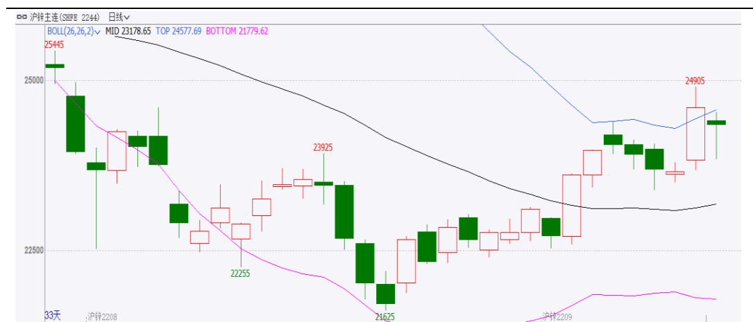
图表 1：沪锌主力合约走势图