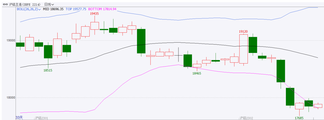
图表 1：沪铝主力合约走势图

本周（1.2-1.6），受美元指数冲高影响，沪铝主连走弱，开盘价18660元/吨，收盘价17850元/吨，周跌850元/吨，或4.55%。波动范围17685~18680元/吨。成交量减少10.8万手至74.9万手，持仓量增加34722手至17.1万手。