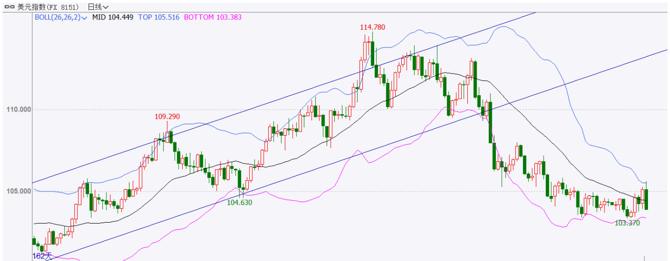
图表 2：美元指数走势图