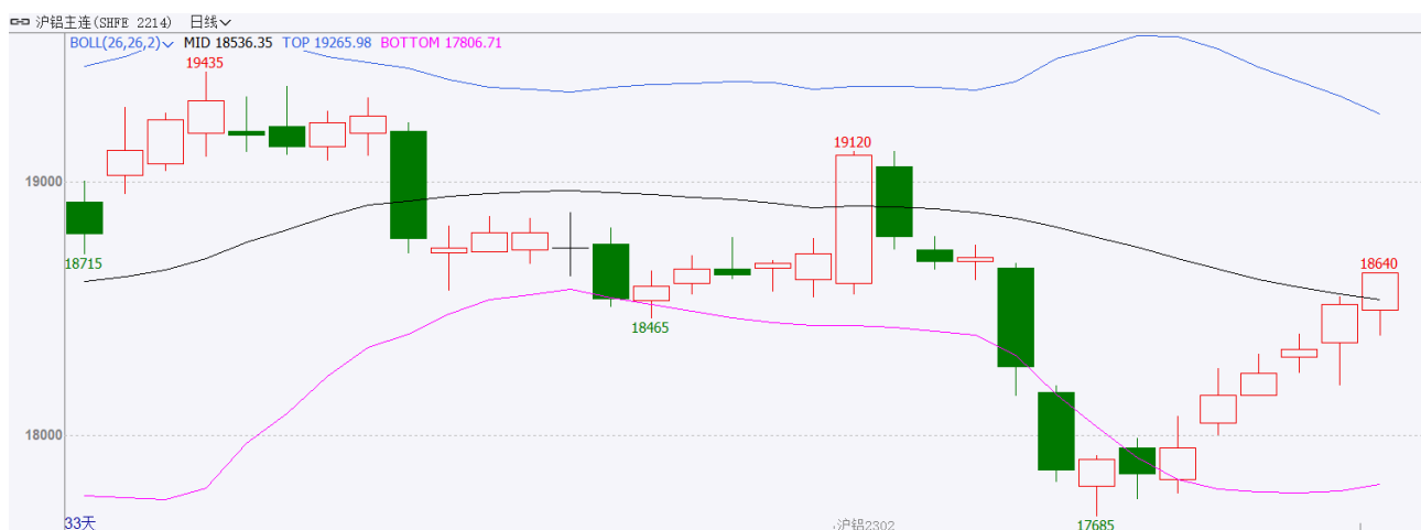
图表 1: 沪铝主力合约走势图