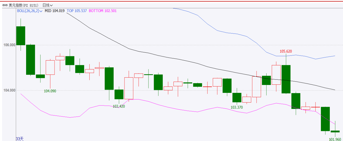
图表 2: 美元指数走势图

本周 (1.9-1.13), 美元指数走弱。开盘价 103.88 点, 收于 102.16 点, 周跌 1.72 点或 1.66%。本周美元指数走弱, 主要因为美国通胀数据再度下降。美国 12 月末季调 CPI 年率 6.5%, 预期 6.50%, 前值 7.10%, 重回“6 时代”, 为连续第六个月下降, 创 2021 年 10 月以来最小增幅。美元指数回落, 利好铝价。