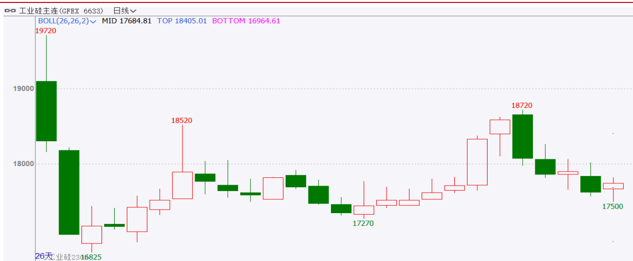
图表：工业硅期货主力合约走势图

1.30-2.4，有色普跌，工业硅期货主力合约 SI2308 走弱，开盘价 18660 元/吨，收盘价 17745 元/吨，周跌 845 元或 4.55%。波动范围：17500~18720 元/吨。