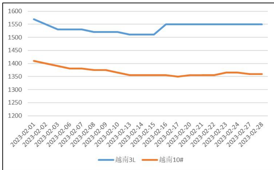
图表 4：东南亚美金胶 CIF 报价

2月初，橡胶期货大跌，带动越南胶船货价格下调。2月中旬后，越南产区整体逐步进入周期性供应淡季，令3L胶止跌上涨。但也因为东南亚市场的橡胶价格较为坚挺，使得买盘活跃度较低。