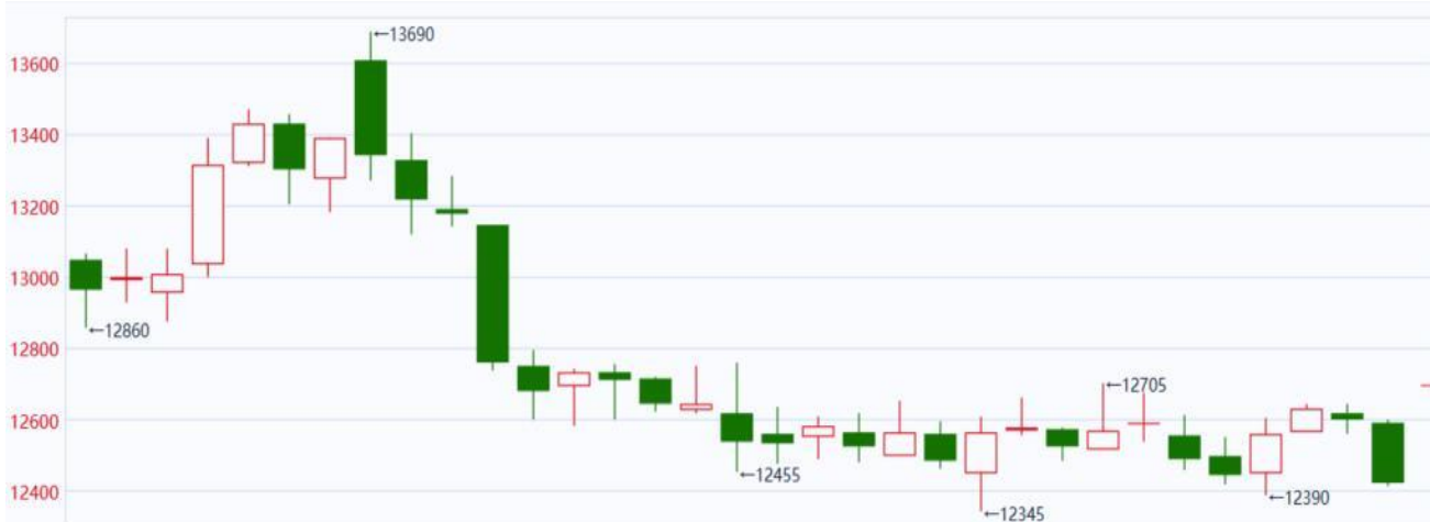
图表 1：2 月份橡胶主力合约 RU2305 走势

由于 2 月份 ANRPC 成员国的主产区大多处于停割期或减产期，进口胶的供应偏紧，令价格在当时有一定支撑。但另一方面，节后消费热潮并未如期而至，对胶价上行的行情形成打压，这两个因素导致 2 月初橡胶主力跌至 12500 附近后进入了一轮震荡调整期。