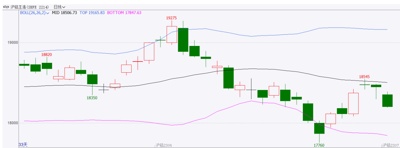
图表 1：沪铝主力合约走势图

本周（5.15-5.19），沪铝主连回暖。开盘价 17990 元/吨，收盘价 18450 元/吨，周涨 580 元/吨，或 3.25%。波动范围 17945~18545 元/吨。成交量减少 23971 手至 88.5 万手，持仓量减少 58978 手至 14.2 万手。本周铝回暖，主要因国内供应依然紧张。