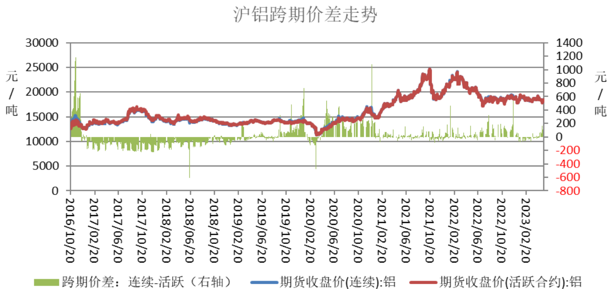
图表 4：沪铝跨期价差分析