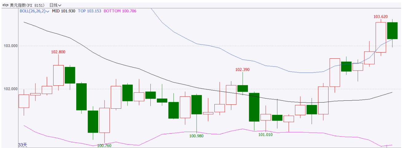
图表 2：美元指数走势图