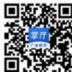
广金期货掌厅APP 期货编号：0108