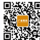
广金期货预约开户码

版权声明：本公众号部分文章推送时，若未能及时与原作者取得联系并涉及版权问题，请及时联系删除。